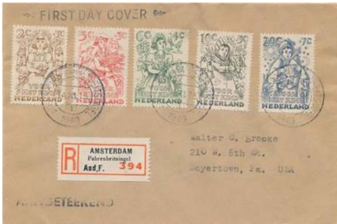
Een 'pre-officiële FDC' met kinderpostzegels, die werd uitgegeven op 14 november 1949.

Hoewel de NVPH in 1950 met de productie begon, ligt het begin van de Nederlandse traditie eigenlijk al in het najaar van 1949. De stichting Kinderpostzegels bracht toen de allereerste Nederlandse eerstedagenvelop uit. Niet lang daarna droeg de PTT het ontwerp over aan de NVPH, die sindsdien verantwoordelijk is voor zowel het ontwerp als de uitgifte van de verzamelobjecten.