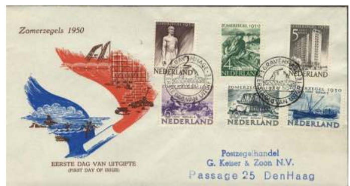
Eerstedagenvelop van mei 1950, met gedrukt adres van een postzegelhandel in Den Haag.

Zeker omdat er de laatste jaren op onze clubveilingen FDC albums, volle dozen of pakketten met dit maatwerk voor een 'appel en een ei' worden