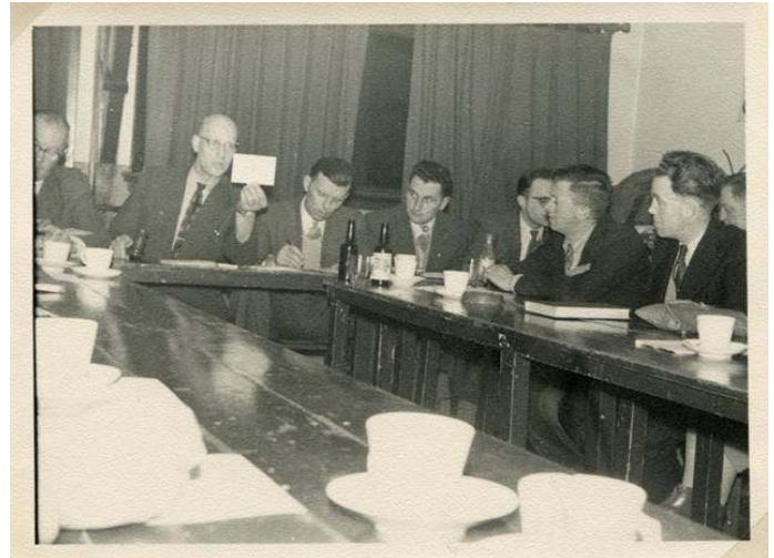
De tweede foto uit ons verenigingsverleden.

De rechter foto was gemaakt in de bestuurskamer van Veiling Bloemenlust. Deze ruimte heeft ook voor onze vereniging historische betekenis: