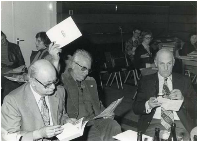
Deze foto was eerder afgebeeld op de voorzijde van ons maandblad van april 2025.

Vorig jaar april verrijkten deze twee foto's ons verenigingsblad en stelde de redactie u de vraag: we kent deze mensen en waar en wanneer zijn de foto's gemaakt?